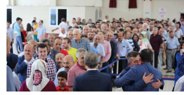
"Başiskele Yine Binlerce Komşusuyla Bayramı Kutladı"