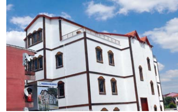
"Vezirçiftliği Semt Konağında Sona Doğru"