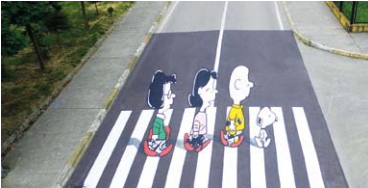
"Photoshop Değil Gerçek"