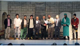
"Kültür Kenti Başiskele"