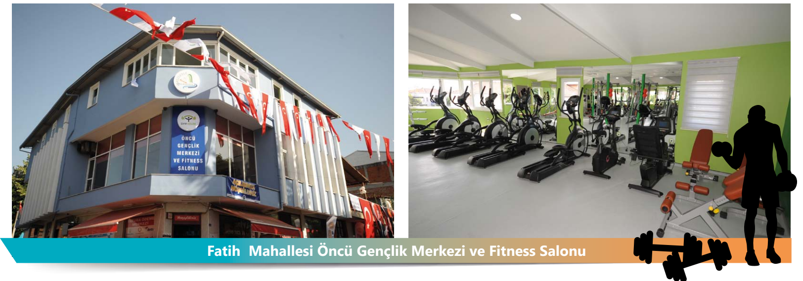
Fatih Mahallesi Öncü Gençlik Merkezi ve Fitness Salonu

Spor evrensel kültürün bir parçası olduğundan dolayı ,Kamu hizmeti olarak belediyemizin 2. Açılışı "Öncü Gençlik Merkezi Sve Fitness Salonu " olmuştur. Toplumda cinsiyet ayrımı olmaksızın yapılan hizmette bayanlara açılan hizmetin devamı olarak erkeklere yapılan bir proje gerçekleştirilmiştir. Genç erkek bireylerin topluma kazanılması, boş zamanlarında sporu alışkanlık hale getirip kötü alışkanlıklarından uzak tutmak adına yapılan toplumsal bir projemizdir.