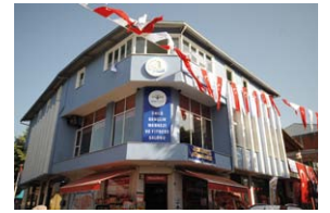
"Genç Başkandan Gençlere Büyük Jest" Gençlik Merkezi