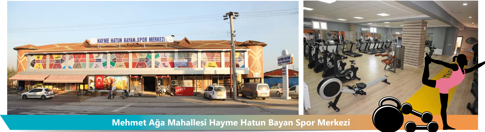
Mehmet Ağa Mahallesi Hayme Hatun Bayan Spor Merkezi

Başiskele Belediyesi Spor merkezleri ve fitness salonlarını halkın ihtiyacına cevap verecek şekilde ilçemizde bir çok yerde açılışlarını gerçekleştirmiştir. İlk açılış; öncü ve örnek proje anlamında "Hayme Hatun Bayan Spor Merkezi " olmuştur. Bayanlara yönelik olarak açılan spor merkezi, fitness, aerobik, pilates , gibi spor alanlarında bayanların günlük yaşantısındaki sıkıntıları ve özellikle de şehir yaşamının getirdiği yoğun stres, gelişen teknoloji ve onun gerisinde kalmanın doğurduğu geleceğe yönelik kaygılardan kurtuluşun belki de en kolay yeri haline gelmiştir. Proje sadece spor etkinlikleriyle kalmamakla birlikte, diyetisyen, hemşire odası da bu merkezde hizmet vermektedir.