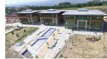
"Yeni Hizmetler Yeni Belediye Binasından Halka Ulaşacak"