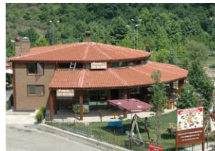
"Gözde Mekanlar Ada Cafe & Restaurant"