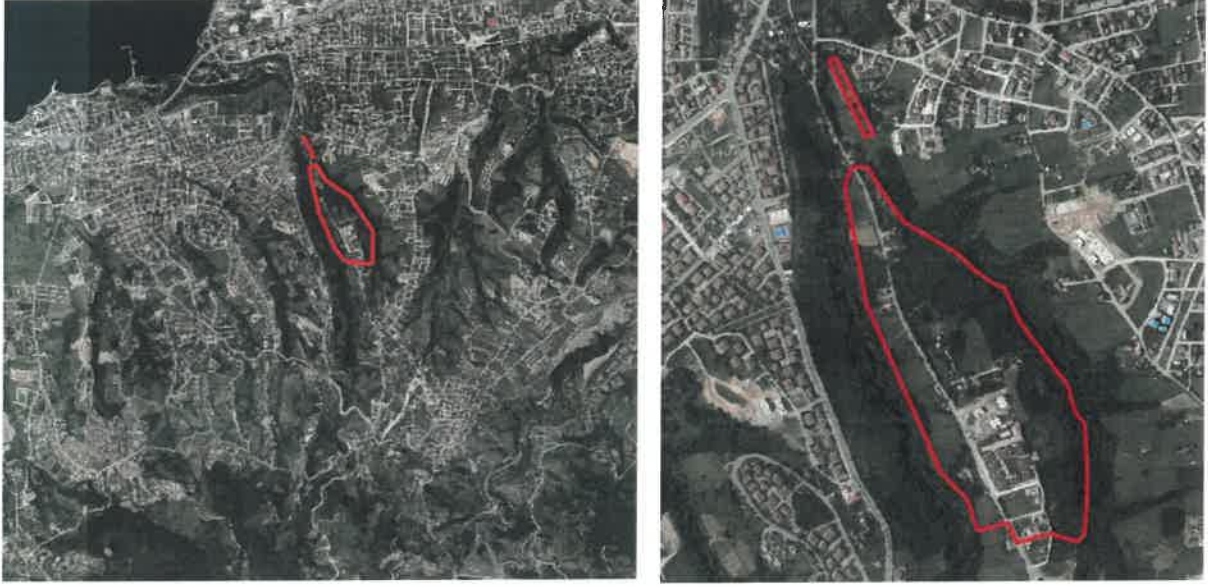
Şekil. Planlama Alanının Konumu

Planlama alanı, Kocaeli İli, Başiskele İlçesi, Fatih ve Yeşilyurt Mahalleleri sınırlarında G23C04C2C, G23C04C3B, G23C05D1D, G23C05D4A, G23C05D4C ve G23C05D4D no.lu uygulama imar planı paftalarında yer alan; 89 no.lu şuyulandırma bölgesi olarak nitelendirilen alandır.